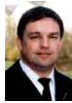
Ralf Ackermann Präsident des LFV