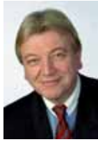
Volker Bouffier Minister des Innern und für Sport