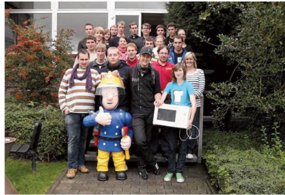
Gruppenbild im Oktober 2010